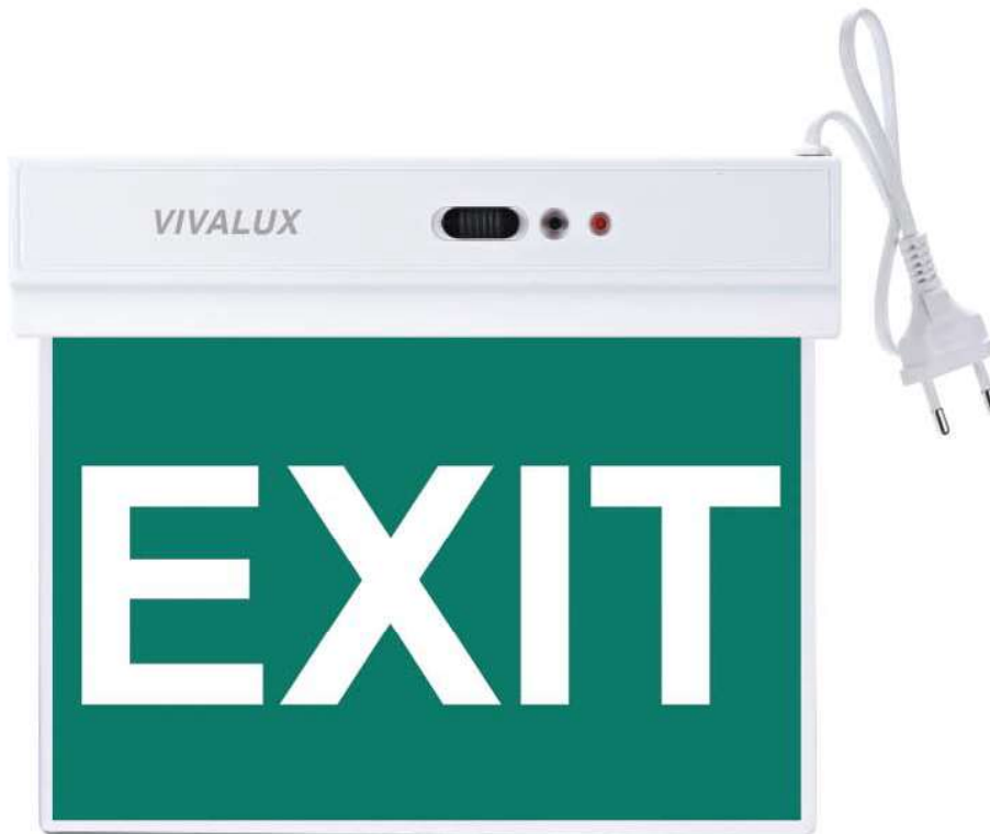
SALVE LED 1.8W